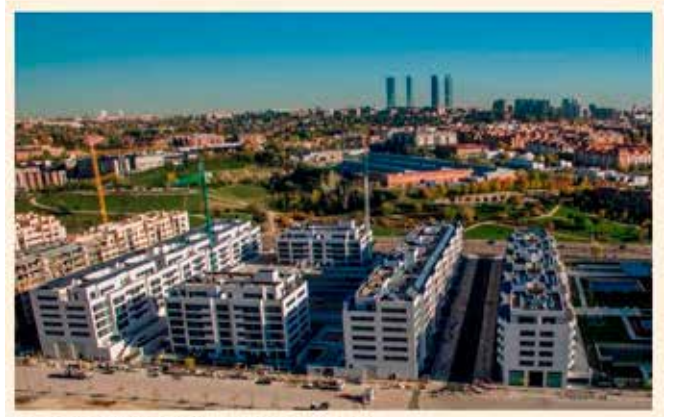
Pisos en la nueva zona residencial del norte de Madrid | EXPANSION

El Colegio Oficial de Agentes de la Propiedad Inmobiliaria (Coapi) de Madrid estima un crecimiento de entre el 13% y el 15% en el número de operaciones de compraventa de vivienda (nueva y usada) en 2018.